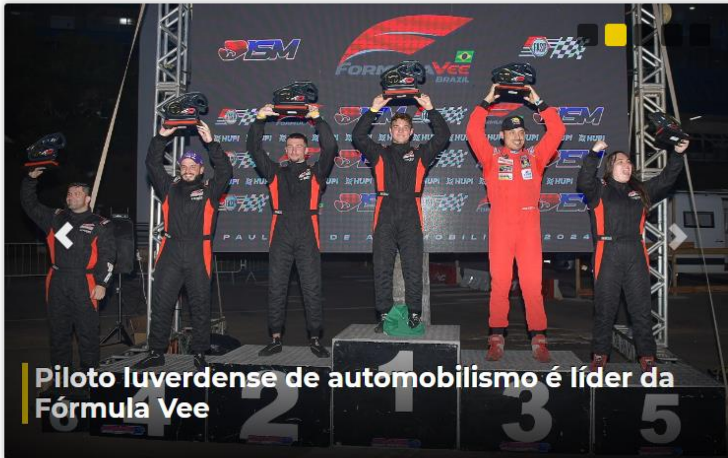
Piloto luverdense de automobilismo é líder da Fórmula Vee