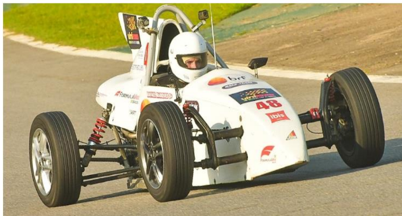
Redação Só Notícias