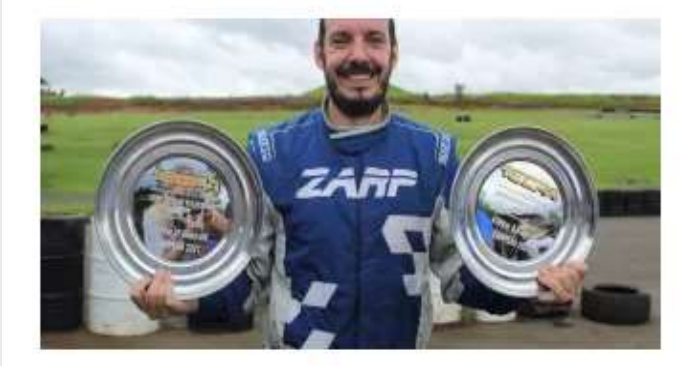
Piloto de São Carlos é bicampeão e bate recorde de vitórias na Fórmula Vee