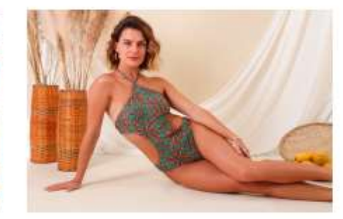
Vai viajar? A Líquido possui o look ideal para o seu...