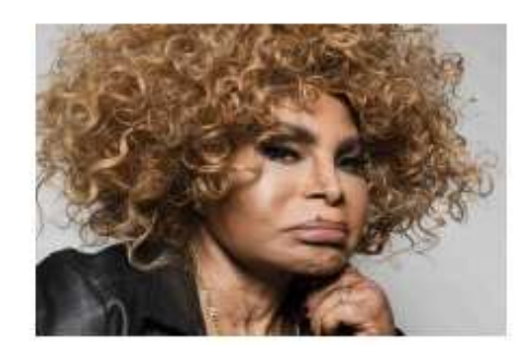
Morre, aos 91 anos, a cantora Elza Soares