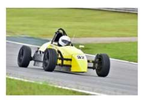
Coluna Aberta: Piloto Guarulhense acelera para iniciar a temporada 2022