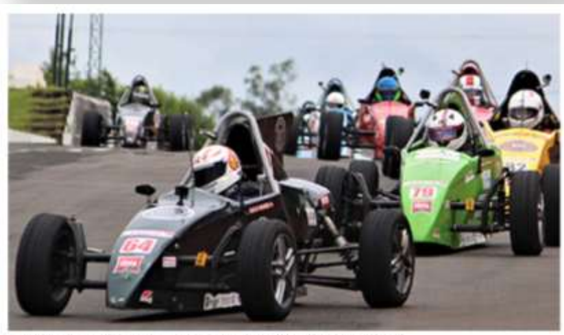
Science (64) e Somaga (79 ) conquistaram de titulos na celegoria Méster.