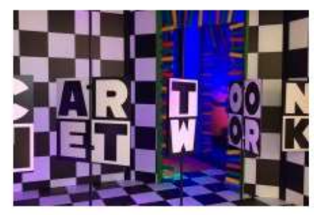
Parque Shopping Maia recebe Espaço Cartoon Network