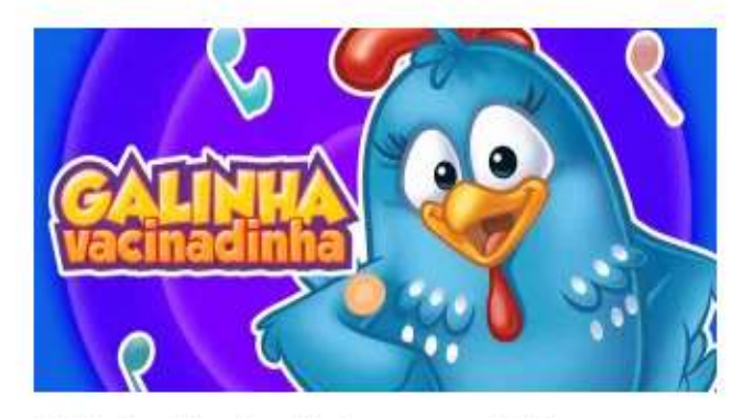
Galinha Vacinadinha em ação!