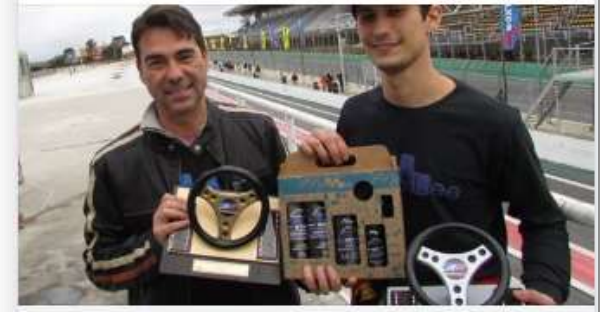
JORNALDAMANHAMARILIA.COM/BR Mariliense tem a melhor estreia de um piloto novato em Interlagos | Jornal da Manhã

#fvee #formulavee #marilia #jornaldamanhâ #automobilismo #interlagos