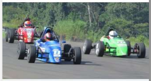
ETMANIA LANCE COM BR FVee na Copa dá oportunidade a jovens pilotos neste sábado, em Piracicaba - Outras Categorias - F1Mania

E se você quiser participar do FVee na Copa, ainda dá tempo para se inscrever. Serão dois treinos livres, uma classificação e duas baterias. Tudo no sábado, a partir das 8h30 no ECPA, em Piracicaba. Para participar, lígue (11) 3384-9356. Mais informações sobre a FVee acesse www.fvee.com.br #fvee #formulavee #formulaveebrazil #ecpa #oiracicaba #automobilismo #kart #kartismo