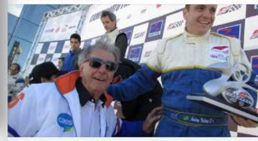
RIBEIRAOPRETO SP.GOV.BR Piloto de Ribeirão cria campanha para disputar a Fórmula Vee Campanha #JuntosSomosFortes visa captar patrocínios durante a Copa d...

#JuntosSomosFortes #fvee #formulavee #formulaveebrazil #ribeiräopreto #automobilismo #interlagos