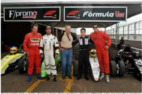
ta Augustus para a rendra Zigorian Saras, Danis Penning, Warnes Pittanis, Likis Ayna Rayda e Cristin Danarit, na Aukuttania misinaszonia-da Ganzao Brakas zinte Filmula ibai Devigação)

petro sub-mato-prosteme Terms Petrosa sa largar Lono principal facotto an Taob de Cepada Unio Consele de foir de Petrosal Vez, neces saltante, no Autobrito Internacional de Campo Grande