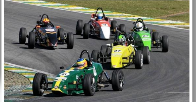
Corrida na Fórmula Vee.

O Estado fez o teste semanas atrás dentro de um Fórmula Vee no autódromo paulistano. A categoria, fundada na década de 1960 pelos irmãos Fittipaldi, cobra R$ 500 do 'calouro' que quer pilotar os mesmos bólidos usados nas competições.