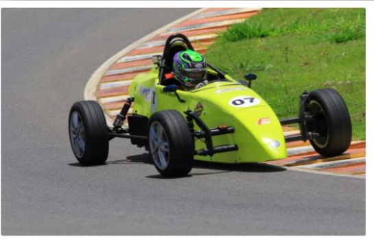
0 Piloto não venceu nenhuma prova, mas teve o melhor somatório

Na primeira prova, ele ficou atrás de Zigomar Junior por apenas 0s493. Ele ainda foi favorecido pela desclassificação de Cristiano Denardi. O ex-líder do campeonato foi punido por uma ultrapassagem irregular quando o safety car estava na pista e praticamente perdeu as chances de ser campeão.